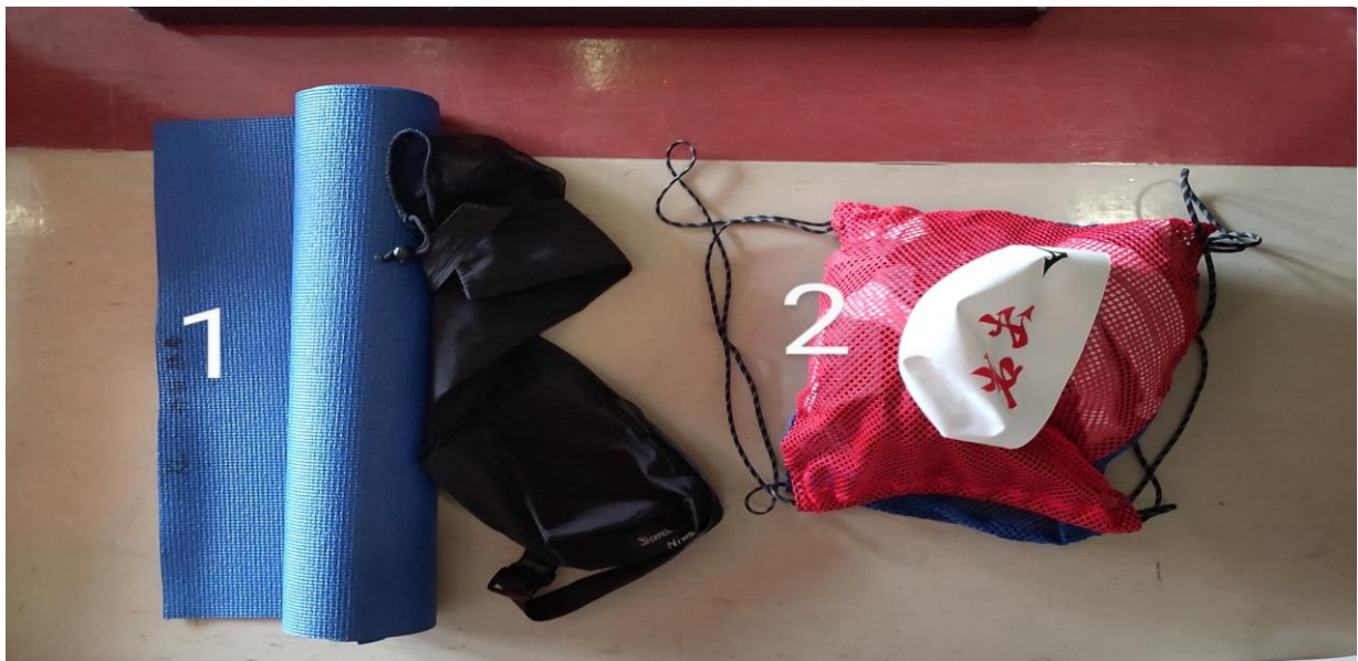
1は、わかやまオープンの忘れ物